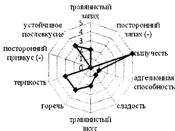
Рисунок 1 – Профилограмма органолептических характеристик порошка топинамбура

На основании полученных результатов органолептических испытаний была построена профилограмма (рисунок 1).