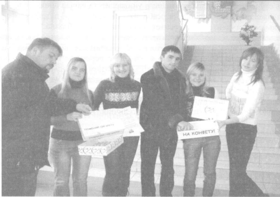
Рисунок 4 – Акция, посвящённая Дню борьбы с курением «Меняю сигарету на конфету»

Основными приоритетами государственной политики Республики Беларусь является создание условий для возрождения в белорусском обществе мировоззрения, основанного на духовно-нравственных ценностях, посредством добровольного участия молодёжи в гуманных акциях. Студенты университета, как наиболее мобильная группа молодёжи, всегда активно откликаются на призыв о помощи, они готовы к безвозмездной работе. Милосердие учит студенческую молодёжь жить среди людей и для людей. Реализуясь в волонтерской деятельности, студенты не только проявляют заботу о детях, пожилых людях, но и по-иному оценивают и преобразуют самих себя.