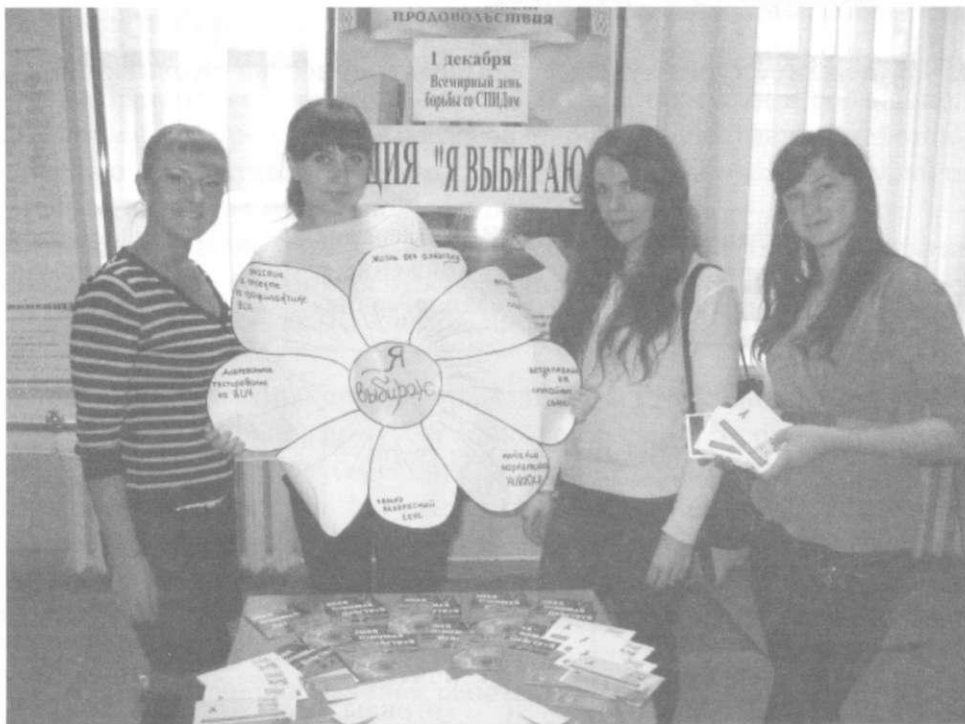
Рисунок 3 – Молодёжная акция «Я выбираю здоровье»

Для приобщения большего количества людей к здоровому образу жизни используются различные мероприятия. Это тематические вечера с конкурсами, играми и многое другое.