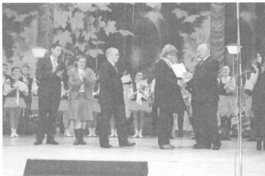
Рисунок 1 – Гала-концерт конкурса художественного творчества «Коллекция идей 2014»