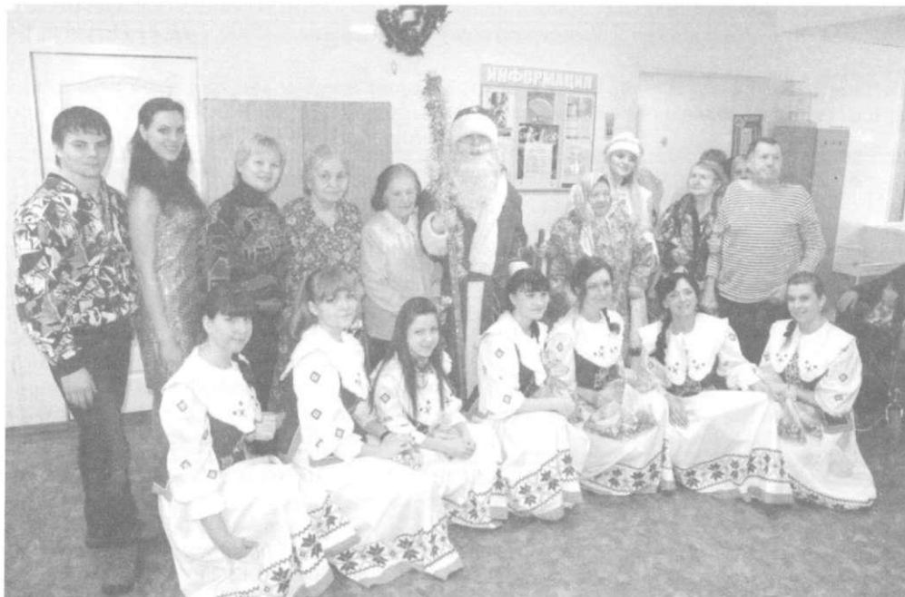
Рисунок 5 – Новогодняя благотворительная акция в УЗ «Могилёвская больница сестринского ухода»

Основными приоритетами государственной политики Республики Беларусь является создание условий для возрождения в белорусском обществе мировоззрения, основанного на духовно-нравственных ценностях, посредством добровольного участия молодёжи в гуманных акциях. Студенты университета, как наиболее мобильная группа молодёжи, всегда активно откликаются на призыв о помощи, они готовы к безвозмездной работе. Милосердие учит студенческую молодёжь жить среди людей и для людей. Реализуясь в волонтерской деятельности, студенты не только проявляют заботу о детях, пожилых людях, но и по-иному оценивают и преобразуют самих себя.